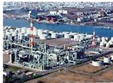
北海道にある出光の製油所。

廃棄物を減らしたり再利用する過程では、燃料を使うため、二酸化炭素を出すこともあります。そうした廃棄物の再資源化による影響も考慮しながら、出光は、自社規定を1%から0.5%以下にすることを視野に活動していきます。