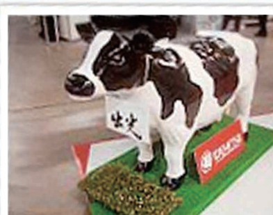
ブースのかたわらに立つ牛の姿に来場者は 興味しんしん。